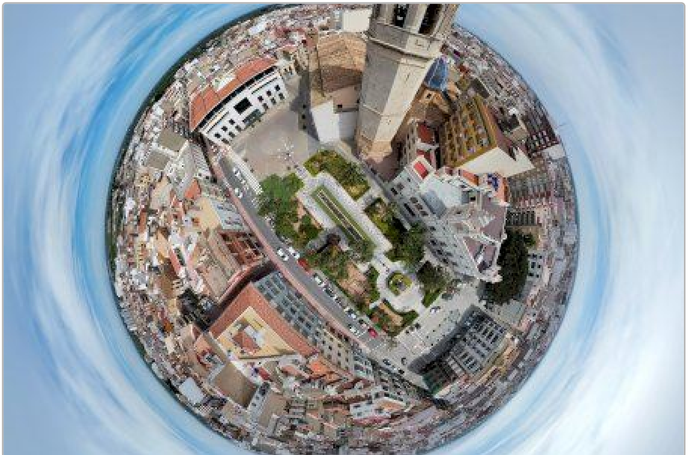
Burriana a vista de pájaro, la historia de un holandés enamorado de la ciudad